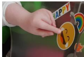
Spricht für sich, oder?